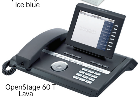
OpenStage 60 T Lava