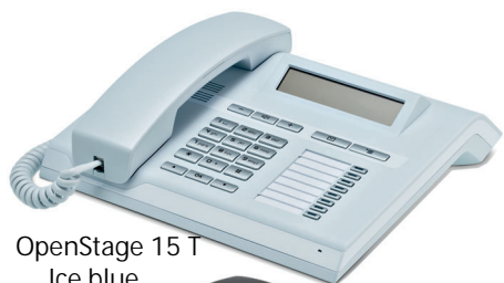
OpenStage 15 T Ice blue