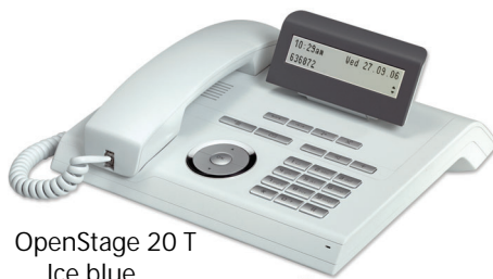
OpenStage 20 T Ice blue