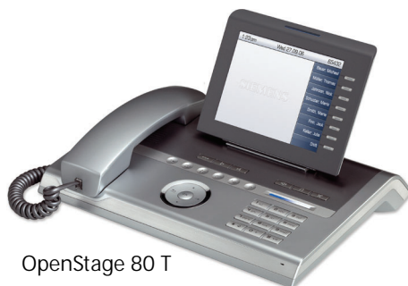
OpenStage 80 T