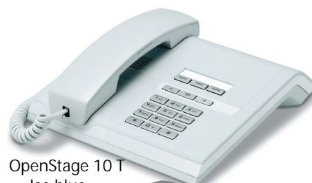
OpenStage 10 T Ice blue