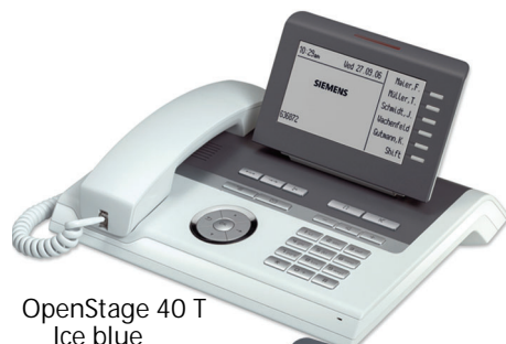
OpenStage 40 T Ice blue