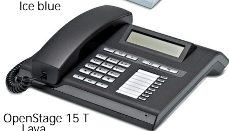
OpenStage 15 T Lava