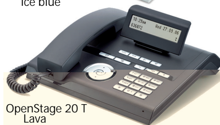
OpenStage 20 T Lava