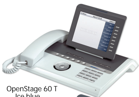
OpenStage 60 T Ice blue