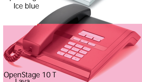
OpenStage 10 T Lava