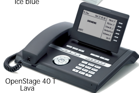
OpenStage 40 T Lava