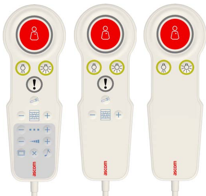
Figure 1: Manipulateur avec jack 3.5mm pour écouteur