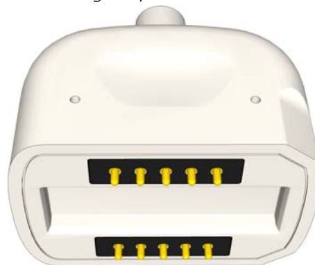
Figure 2: Prise magnétique Ascom SafeConnect

Deux des coins de la prise ont une partie plate pour éviter toute installation incorrecte. Les parties plates de la fiche doivent être alignées avec les parties plates du logement. Voir figure 3